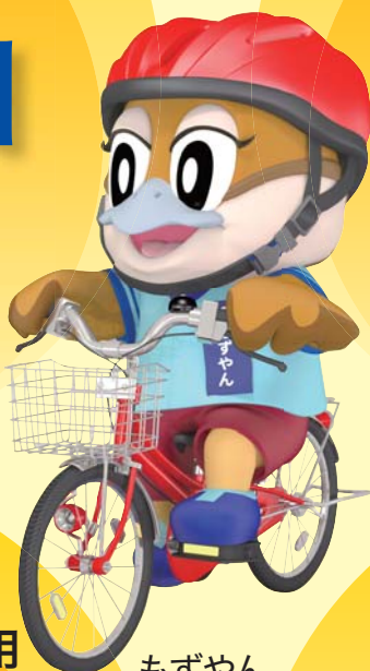
もずやん 大阪府広報担当 副知事